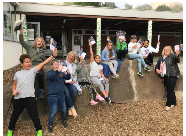
Voller Freude halten die Schülerinnen und Schüler ihre Bücher in den Händen