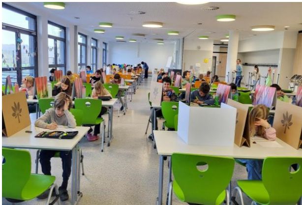
Konzentriertes Arbeiten während des Känguru-Wettbewerbs