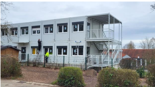
Arbeiter treffen vor den Osterferien Vorarbeiten für den Abbau der Containeranlage unterhalb der Degerfeldschule

Seit den Herbstferien 2018 steht eine Containeranlage mit sechs Klassenzimmern auf dem öffentlichen Spielplatz der Stadt Butzbach unterhalb der Degerfeldschule. Zahlreiche Schülerinnen und Schüler der Jahrgangsstufen drei und vier hatten darin Unterricht. Nun werden die Container in den Osterferien abgebaut und in Bädlingen an einer anderen Schule aufgebaut und genutzt.