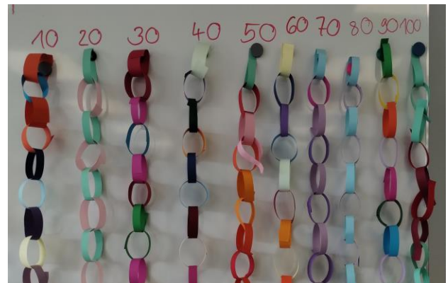
100 Kettenglieder sind entstanden