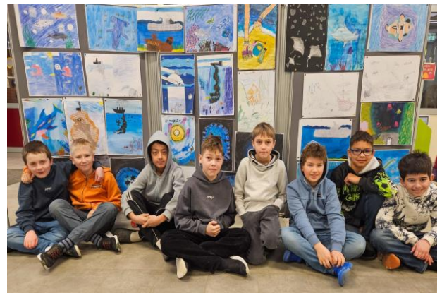
Kinder der Klasse 4b vor ihren Kunstwerken, die in der Pausenhalle ausgestellt waren

Der Wettbewerb hat einmal mehr gezeigt, wie kreativ, engagiert und nachdenklich sich die Schülerinnen und Schüler der Degerfeldschule mit wichtigen Themen unserer Zeit auseinandersetzen.