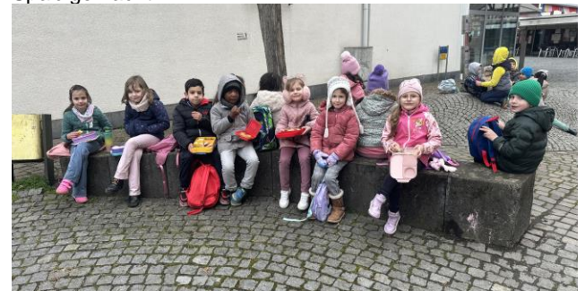
Gemeinsames Frühstück vor dem Kinobesuch

Nach dem Film konnten sich die Kinder noch auf dem Spielplatz „Vicus Romanus“ austoben oder bei einem zweiten Frühstück stärken. Allen hat der Ausflug viel Spaß gemacht.