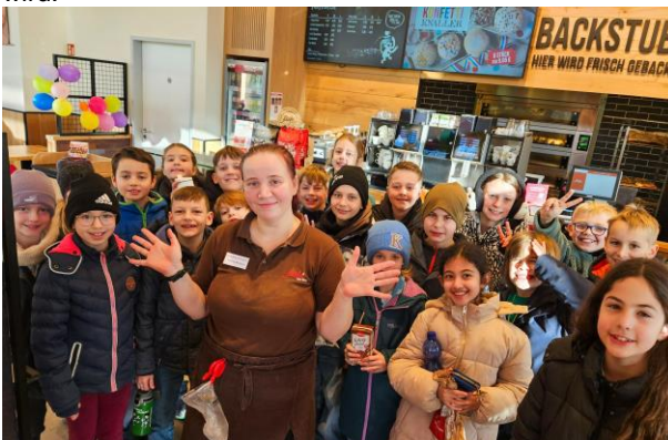
Kinder der Klasse 4c in der Bäckerei Schäfer

Ein rundum gelungener Abschluss der Englisch-Einheit, der den Kindern sicher noch lange in Erinnerung bleiben wird.