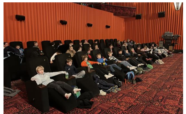
Die Schüler und Schülerinnen des Jahrgangs drei während des Kinofilms „Zirkuskind“