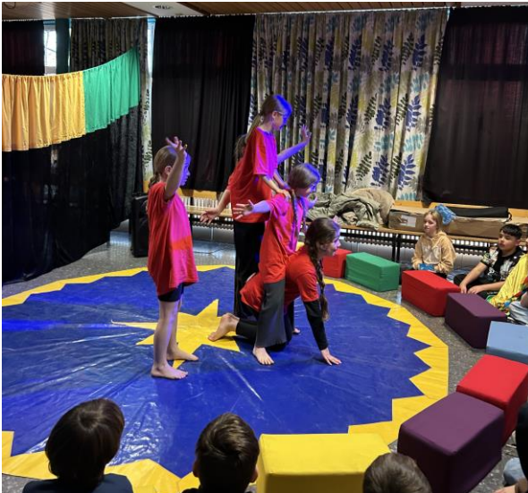
Der große Auftritt am Abend