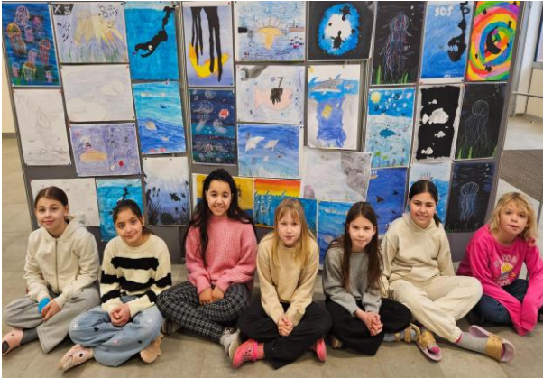
Kinder der Klasse 4b vor ihren Kunstwerken