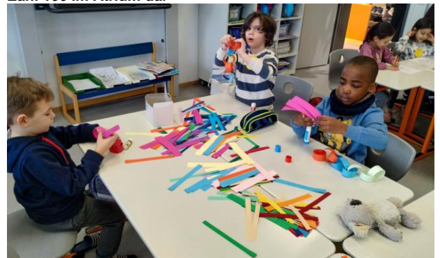
Die Schülerinnen und Schüler nutzen das Bastelangebot