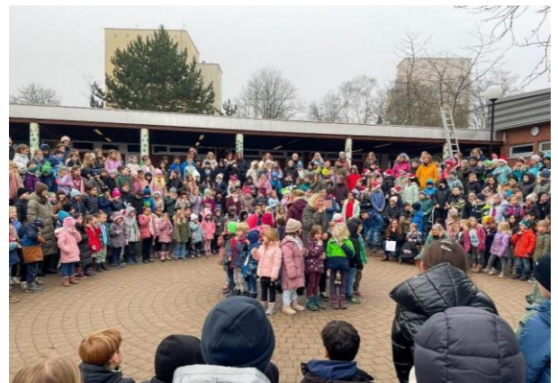
WÄHREND DES LIEDES „DANKE, SAG ICH LEISE DANN!“