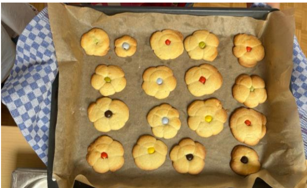
Viele leckere Blüten-Plätzchen sind entstanden