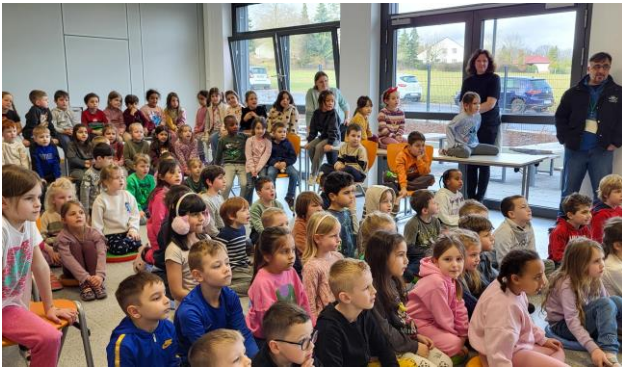
Begeisterte Eingangsstufenkinder beim Zuschauen