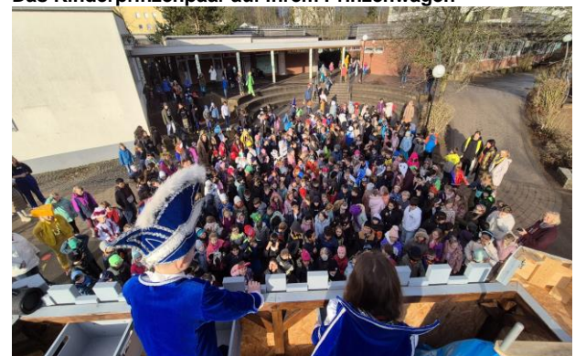
Die Kinder der Schule freuen sich auf die süßen Leckereien