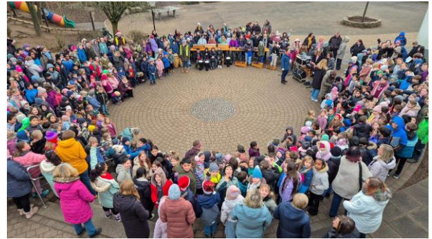
Die Schulgemeinde im Atrium während der Verabschiedung

Ein herzliches Dankeschön an die Organisatoren und Mitwirkenden für die großartige Veranstaltung.