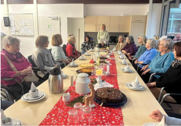
DIE EHEMALIGEN KOLLEGINNEN IM LEHRERZIMMER AN DER GEDECKTEN KAFFEETAFEL