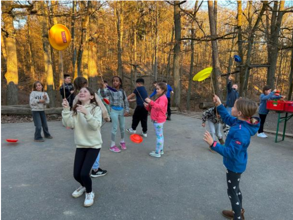
Üben für den großen Auftritt