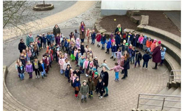
Die Kinder der Jahrgangsstufe E1 stellen gemeinsam die Zahl 100 im Atrium dar

aufgefädelt, 100 Dinge aus dem Klassenraum wurden zusammengetragen. Alle Kinder der E1 trafen sich auf dem Schulhof und bildeten eine 100, dabei war riesige Freude zu spüren. Am Ende des Schultages verabschiedete man sich fröhlich mit selbst gebastelten „100er-Brillen“ und „100er-Kronen“.