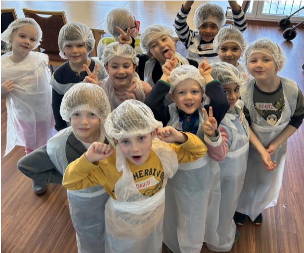
Die Klasse E1e ist bereit für das Backen