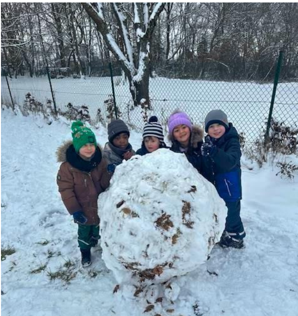
Fröhliches Treiben im Schnee – Kinder der Klasse E1b

Endlich Schnee. Die Kinder der E1 nutzten das traumhafte Wetter, um auf dem Feld hinter der Schule im Schnee zu spielen, anstatt in den Wald zu gehen. Wer im Degerfeld unterwegs war, konnte daher zum Beispiel „Schneeengel fliegen sehen“. Es gab "Schneemannarchitekten und Tiefschneetaucher". Es war ein herrlicher Tag rund um das Element Schnee.