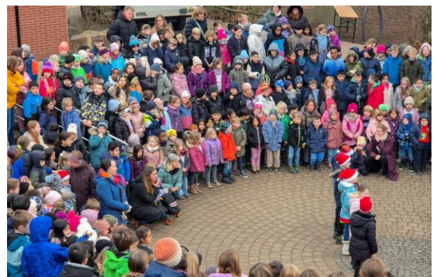
WÄHREND DES TANZES DER AG-KINDER