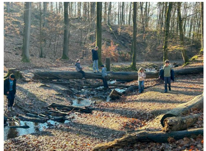
Freies Spielen am Bach unterhalb der Jugendherberge

Alle Kinder waren sich einig, dass es, obwohl einzelne Kinder Heimweh hatten, eine tolle und lustige Zeit in Grävenwiesbach war.