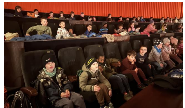
Während des Films „Willkommen in Schmuddelfing“