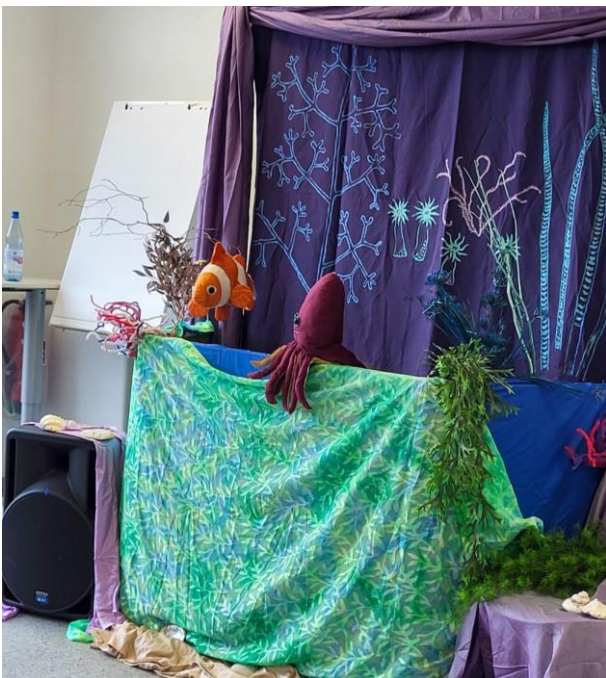
Die Kinder der Eingangsstufe während der Theatervorstellung Tina Tintenfisch